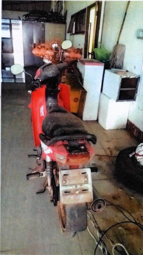
รูปถ่ายรถจักรยานยนต์ ยี่ห้อ HONDA ทะเบียน กตม.๗๒๗ นครพนม